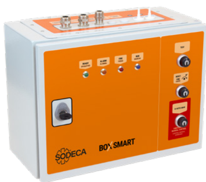
Tableau de contrôle avec ventilateur de secours

Le tableau de contrôle BOXSMART comprend :