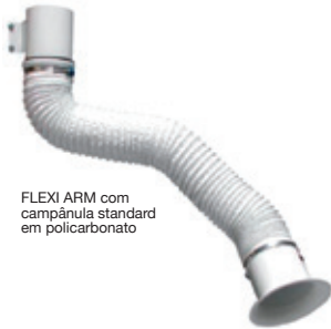
FLEXI ARM com campânula standard em policarbonato