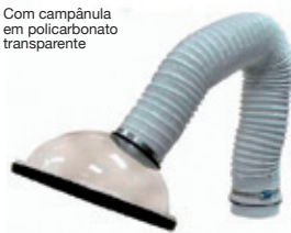
Com campânula em policarbonato transparente